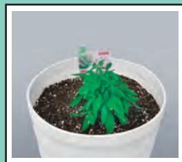
ポット苗(1株)を6月に植え込み