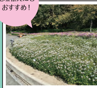
10月(三重県 なばなの里)