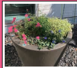
5月下旬(愛知県) ポット苗(2株)を植え込み