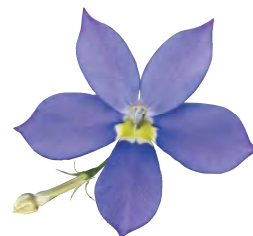
グローイングパープル