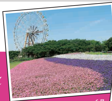
6月 (埼玉県 東武動物公園ハートフルガーデン)